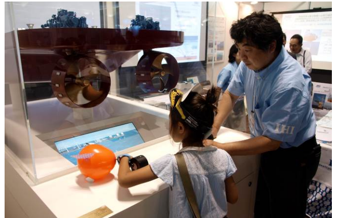
④各ブースの様子（その2） （IHIブースのシミュレーターで船の 操作を体験）