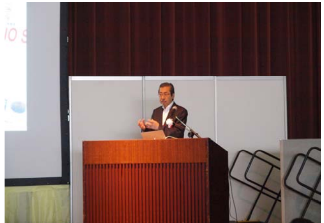
⑥海洋研究開発機構 平理事長による講演(22日)