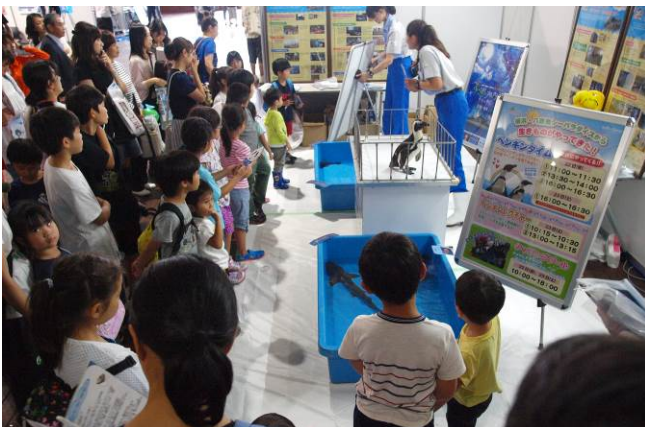
③各ブースの様子（その1） （横浜・八景島シーパラダイスブースに ペンギンが登場）