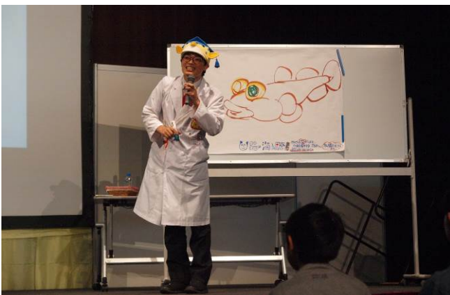
⑨さかなクンが横浜の海の魅力について講演 今日からできる「環境行動」を宣言!