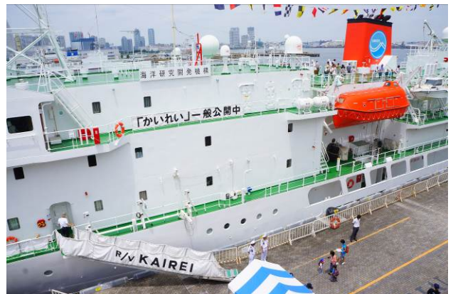
⑧深海調査研究船「かいらい」の一般公開