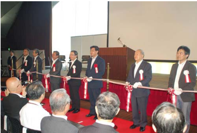
①オープニングセレモニー（22日）