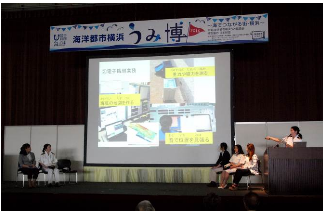
⑦海の女子会では海洋関連業務で活躍している女性が仕事や海の魅力を紹介