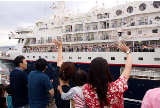
⑤客船「にっぽん丸」をみんなでのお見送り(22日)