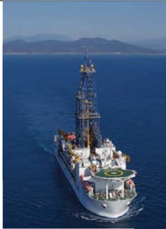
海洋研究開発機構 (JAMSTEC)

国 立研究開発法人海洋研究開発機構 (JAMSTEC) は、日本唯一、かつ世界における中核的な海洋に関する総合的研究開発機関です。地球環境の保全、防災、資源確保等の人類の生存にとって不可欠な、海洋・地球・生命に関する諸活動を推進するため、様々な分野の研究者だけでなく、海洋調査機器の開発・運用に携わる技術者、これらの研究開発推進をサポートする事務系職員など多様な職種の職員が活躍しています。