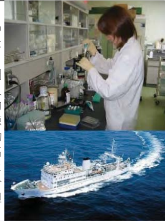
水産研究・教育機構

水 産研究・教育機構は、横浜市の本部を中心に、北は北海道から南は石垣島まで、全国に9つの研究所、開発調査センター、水産大学校と9隻の調査船、2隻の練習船を擁し、約1100人の常勤職員（うち研究開発職員は約520人）が勤務しています。水産資源の評価と管理技術、海洋環境の変動把握、増養殖技術、安全・安心で高機能な水産物の利用、港湾や船舶などの水産工学等、水産のすべての分野に関する研究開発や、水産業を担う人材の育成などを行っています。