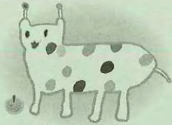
戸塚区のマスコット ウナシー