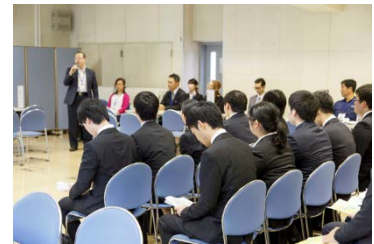
企業説明会の様子