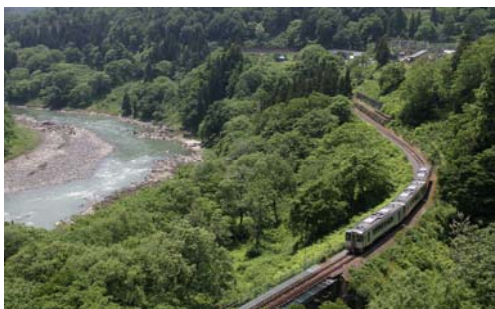
村内を流れる千曲川

地形は複雑で千曲川最下流のため長野県で一番低い標高(256m)から苗場山(2,145m)鳥甲山(2,037m)佐武流山(2,191m)など2,000m級の山々がそびえ、高低差の激しい中、千曲川、志久見川、中津川等の大小河川が環流しています。