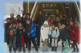
*昨年の報告会と北海道下川町で行われた冬の体験キャンプでの子どもたち