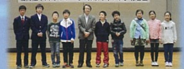
環境講演会「教えて！海の不思議」と北海道下川町での「冬の体験キャンプ」報告会