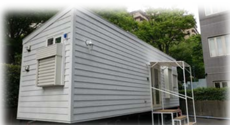
実験実証を行うIoTスマートホーム