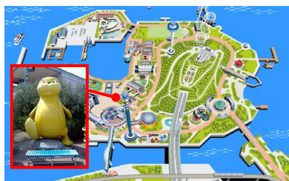
【横浜・八景島シーパラダイス シーパラシー太像】