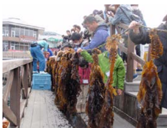
【過去のイベントの様子】