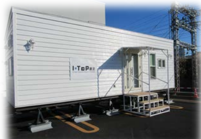
実験実証を行うIoTスマートホーム

横浜市旭区さちが丘47-1（地図裏面） （そうてつローゼンミニ さちが丘店敷地内 二俣川駅北口より徒歩7分）