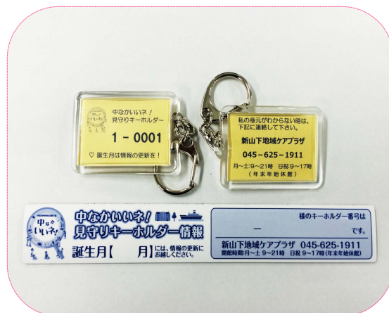
《キーホルダー&マグネットの写真》

A. お名前、住所、性別、生年月日、電話番号、緊急連絡先、かかりつけ医療機関、病歴等、介護保険認定、ケアマネージャー・事業所名等