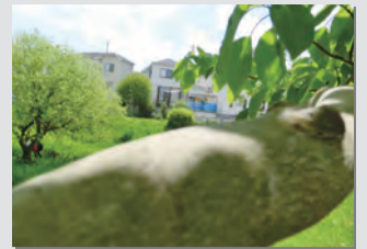
「春風に乗って」