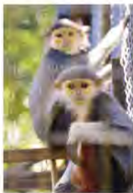
▲ズーラシアで生まれた子もたち

日本では、よこはま動物園ズーラシアでしか飼育していない希少な動物です。ズーラシアが1999年にオープンする1年前にタイの動物園からやってきたアカアシドゥクラングルは、今年で来園20周年を迎えます。その後もズーラシアではたくさん赤ちゃんが生まれ、現在では6頭の子もたちが元気に育っています。4月と5月には、誕生日を迎える3頭の子もたちの特別ガイドも行います。この機会にぜひ会いに来てください。