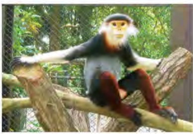
▲来園20周年を迎えるコイ(オス)

アカアシドゥクラングルは東南アジアの熱帯雨林に群れで生息するサル仲間、その体の色から「世界一美しいサル」とも呼ばれています。「アカアシ」の名の通り、赤毛の脚をしていて、真っ黒でつづらな瞳と真っ白で長い尻尾が目を引きまします。木の葉や果物を主食とする「リーフイーターモンキー」です。ベトナム戦争で使用された枯葉剤の