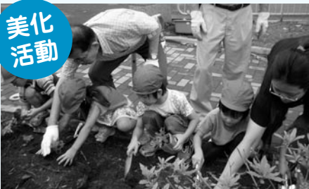
▲公園花壇の手入れの様子