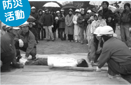
▲小学生も参加しての搬出訓練