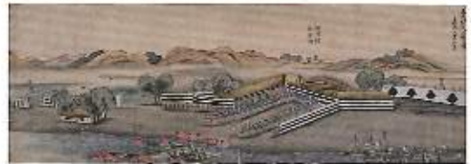
「亜米利加人上陸ノ図」嘉永七年二月