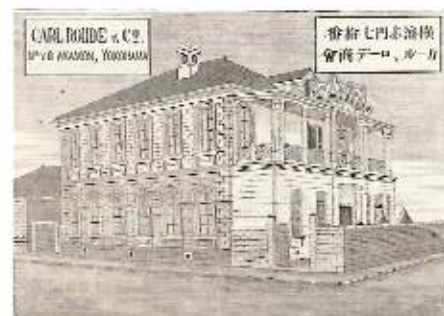
カール・ローデ商会『日本絵入商人録』より