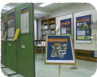
港北オープンヘリテイジ 関連資料の展示 (港北図書館)

◆ 港北の歴史的建造物、ものづくりや地域の取組など特色ある地域情報の収集・提供を通じて、港北の魅力を発信します。