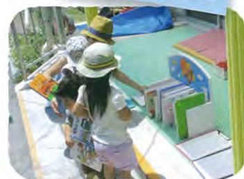
絵本の図書館(区内保育園)