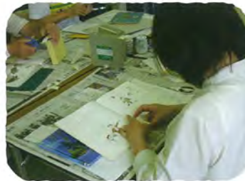
図書修理ボランティア講座 (港北図書館)

◆ 学校や地域で活動する図書修理・読み聞かせ等のボランティア、読書活動団体を支援する講座の開催や情報交換の機会を増やします。