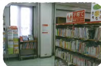
子育て情報コーナー(港北図書館)