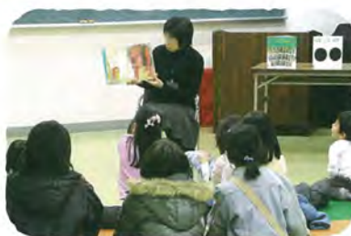
おはなし会(港北図書館)