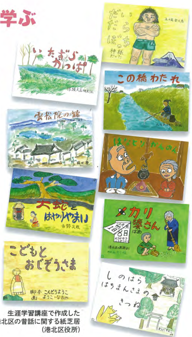
生涯学習講座で作成した 港北区の昔話に関する紙芝居 (港北区役所)