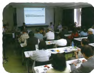
新横浜駅開業50周年 記念シンポジウム (港北区役所・港北図書館)