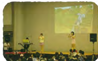
読書イベントの実施(港北区役所)