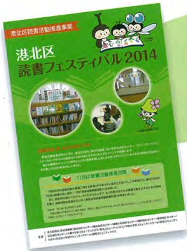
読書フェスティバル2014 開催