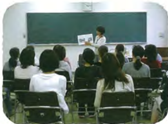
学校ボランティア対象読み聞かせ講座 (港北図書館)