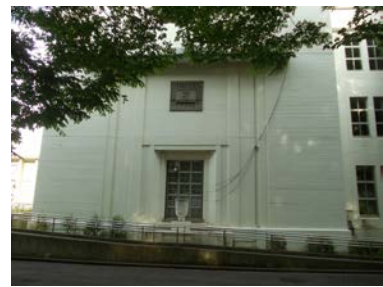
日吉台地下壕保存の会 http://hiyoshidai-chikagou.net/