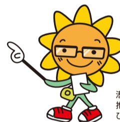
港南区ウォーキング 推進キャラクター ひまわりくん

このほか、室内を加湿して乾燥を防いだり、十分な栄養と睡眠をとるよう心掛けましょう。