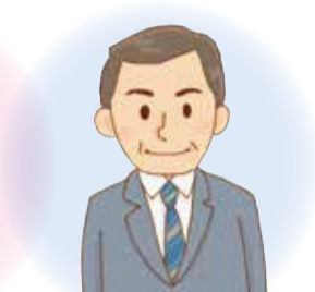
ジョブスポット港南 就職支援ナビゲーター