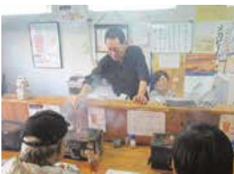
焼き方で違う! おいしいホルモンを食べよう