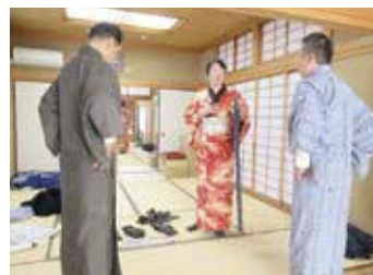
すぐに着られる! 「男のきもの」着付け講座

昨年は58講座が 開催され、 約400人が参加。 満足度97%と 大好評でした!