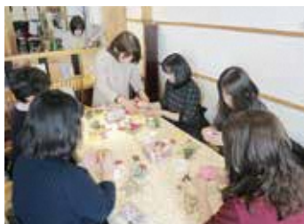
手作りリースで 一足先にクリスマス気分♪