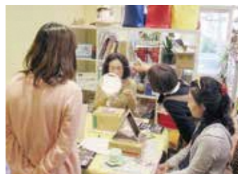
あなたに合わせた 眉の描き方講座