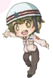
けんこうなん すくすく健港南だ! マスコットキャラクター こなんちゃん