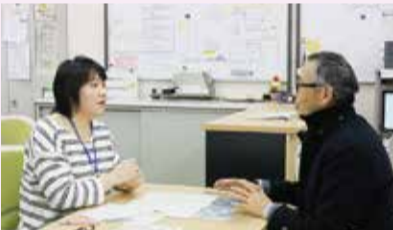
どんなことでも気軽にご相談ください