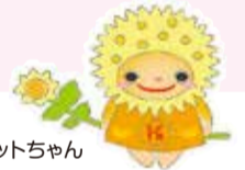
こうなんタネネットちゃん