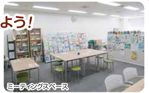
ミーティングスペース

港南区区民活動支援センターは、活動を始めたい人から今の活動を広げたい人まで、生涯学習や市民活動のサポートをしています。退職後に何をしようか迷っている人、子育てが一段落して自分の時間を楽しみたい人、趣味などを一緒に楽しむ仲間が欲しい人もぜひお立ち寄りください。