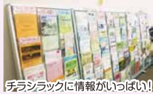
チラシラックに情報がいっぱい!

区内で活動している団体の情報や、イベントの開催情報のチラシを扱う情報コーナーがあるほか、ウェブサイト「ひまわりタネネット」でも活動情報を紹介しています。ここで同じ趣味の活動団体を探すこともできます。