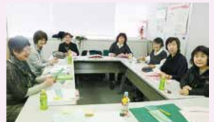
打合せや情報交換にご利用ください

所在地 上大岡西1-6-1 ゆめおおおかオフィスタワー5階 (☎841-9361 ☎841-9362)