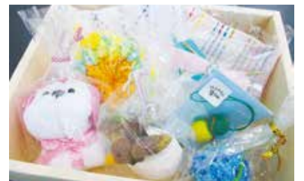
▲ 手作り雑貨もお薦めです