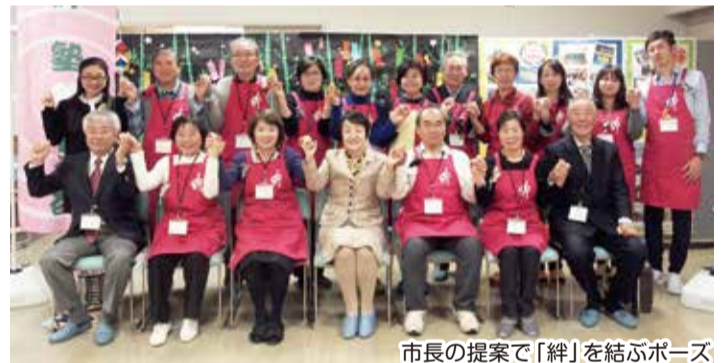
市長の提案で「絆」を結ぶポーズ

市長は「災害に対して、地域の自助・共助の輪を広げていただくことは大変重要です。『活動を通じて大切な仲間に出会い、お互いに高め合っている』という皆さん共通の思いに、とても感銘を受けました。防災・減災から、さらに膨らんで、生き方まで豊かにされているのですね。皆さんとお話して、人肌で伝えていくことが大事だと改めて思いました」と感想を語りました。