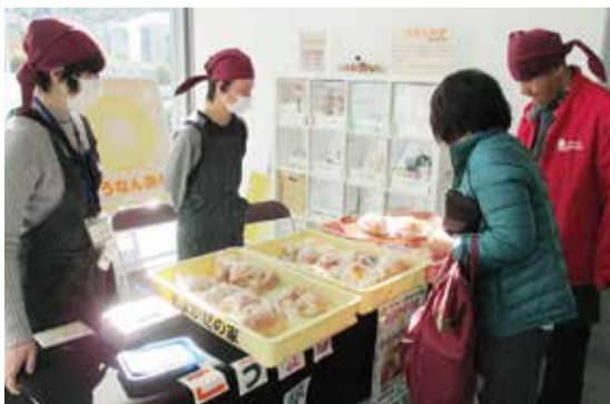
▲ 人気の焼きたてパン

区役所へ行ったとき、入り口近くから「いらっしゃいませ!」「ありがとうございました!」と元気な声がしたら、それは私たち「こうなん来夢」です。