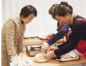
災害時でも温かいものが食べられるポリ袋クッキングに「これは感動」と市長

東日本大震災の後「人と人がつながる下永谷づくり」を目標に発足した「絆塾♥下永谷」。地域ケアプラザを拠点に活動し、特に「避難生活サバイバル体験会」は、地域の人から役に立つと好評です。「ぬくもりトーク」では、活動の紹介や「ポリ袋クッキング」のデモンストレーションが行われました。