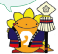
港南消防団 マスコットキャラクター 消防団十郎