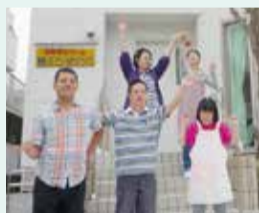
港南台駅近くに移転した「第2ひまわり」

「ありがとう」「お疲れさま」など、温かな言葉や笑顔が行き交い、「今日も行きたい!」と思える大事な場所となることを目指しています。