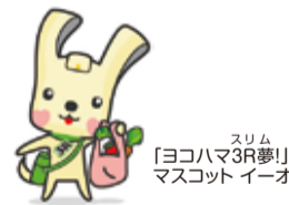
スリム「ヨコハマ3R夢」マスコット イーオ