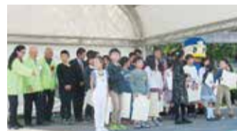
11月4日に表彰式を開催しました