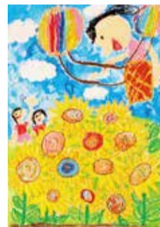
区長賞(低学年の部)

港南区商店街連合会と区役所が共催する「ひまわりの花絵画コンクール」は、今年で5回目の開催となりました。区内・近隣区・ひまわり交流を行っている宮城県大崎市の小学生から作品を募集し、800点を超える応募がありました。すてきな入賞作品30点が、商店街を彩ります。