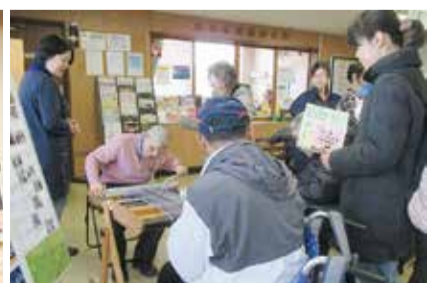
いろいろな作業体験を企画しています

※室内履きと靴を入れる袋をお持ちください ※作業体験には、有料(実費負担)のものがあります