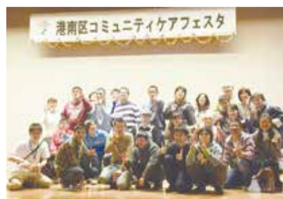
今年も待っています!