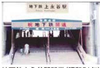
地下鉄上永谷駅開業(昭和51年)