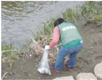
街をきれいにしたいな～