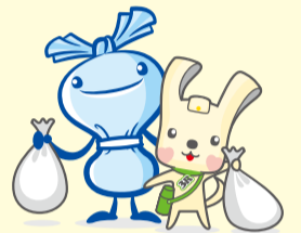
へら星人 ミーオ スリム 「ヨコハマ3R夢!!」 マスコット イーオ

28年度実績は1人1日あたり624g(推計値)でした。29年度は、前年度比7g減により、年間総排出量目標:約48,353t以下を目指します!