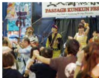
道行く人も踊り出します