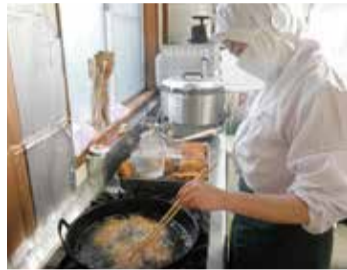
自分たちの昼のお弁当を毎日作っています!

知的障害のある人たちが、一般企業での就労を目指して、弁当製造、繊維製品加工、廃棄物処理などの作業をしています。事業所内だけでなく、企業に出掛けてリサイクルするペットボトルを仕分けるなど、施設の外での作業を多く行っています。