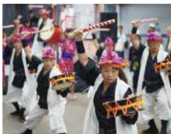
いつもの商店街に沖縄のリズムが響きます

日時 8月27日(日) 11時～18時 ※雨天決行 会場 PASSAGE (上大岡中央商店街、上大岡西一丁目) ※駐車場はありません 問合せ PASSAGE KUNKUN FESTA実行委員会 (米どころ ☎842-1323)