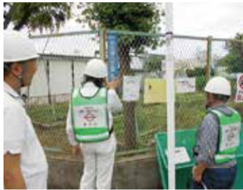
街区表示板の点検・補修作業を市から受託しています