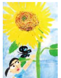
前回区長賞 鈴木 せりさんの作品

応募方法 9月5日までに作品の裏面に住所・氏名・電話番号・学校名・学年を書いて、直接または郵送で区役所地域運営推進係(〒233-0003 港南4-2-10)または区商店街連合会の早川(〒233-0006 芹が谷4-1-4)へ