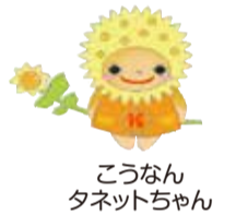
こうなん タネットちゃん

自分の知識や技術を生かして講座やイベント出演を行い、地域の活動に協力するボランティアです。登録を希望する人は、ご相談ください。