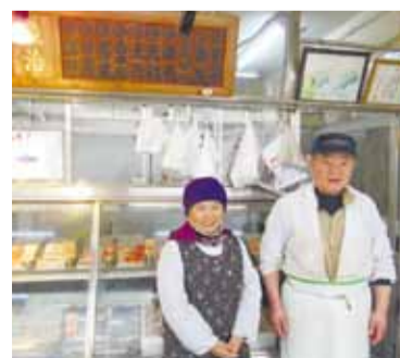
うおはる 魚治鮮魚店