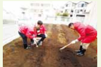
種まきに向けて耕しています

「そよかせの家」をはじめ、区内で3事業所を運営しています。今年2月には、新たに日野一丁目に生活介護事業所「あ〜す そよかせ」を開所しました。ここでは、18歳以上で障害のある人たちが、畑作業やアルミ缶回収・ポスティングなどを行っています。いろいろな発見と笑顔あふれる事業所を目指して、毎日楽しく活動しています。