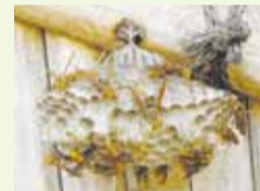
アシナガバチの巣