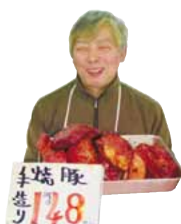
ミートショップ・オックスの 焼き豚 100g 148円