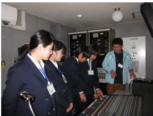
【音響ブースで操作体験】