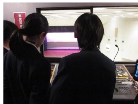
【「色が変わった！」照明操作体験】