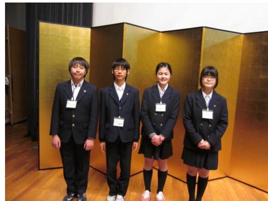
【金屏風の前でパチリ！】