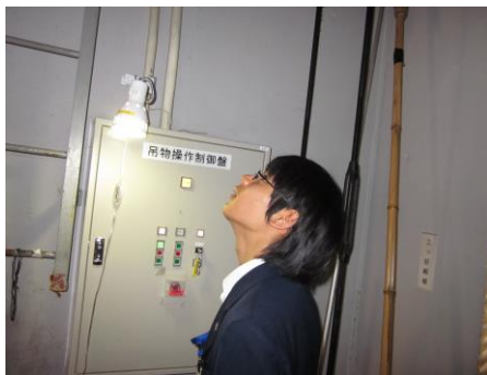
【周囲の確認しながら緞帳を下す】

片付けが終わった後は、普段触ることがないスイッチを操作して、緞帳の上げ下ろしを体験し、貴重な金屏風も見せていただきました。