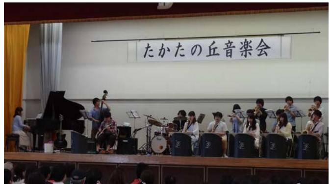
鍛え抜かれた大学生の演奏