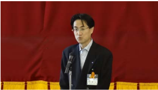
横山 日出夫 港北区長のあいさつ

今年もたかたの丘音楽会が開催されました。横山 日出夫 港北区長も高田地区のキャラクター『たかたん』と一緒に記念撮影。地元高田地区の子どもから高齢者の方々までの支援活動として高田地区社会福祉協議会へのチャリティー募金も実施されていました。