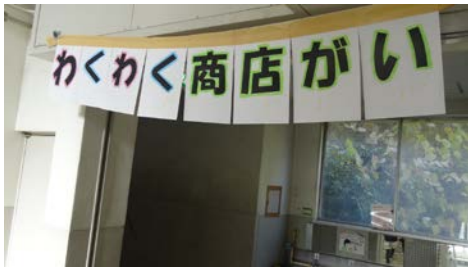
3年生『わくわく商店がい』