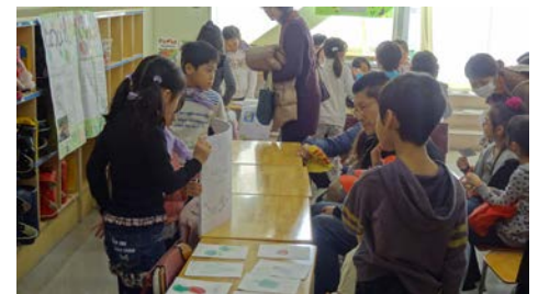
ていねいにていねいに伝え方を考えて説明している子どもたち