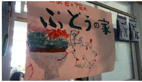
3年生がお店のひみつを教えてくださいます。