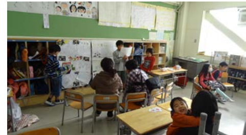
子どもたちの説明に保護者の方々も真剣に耳を傾けていました。