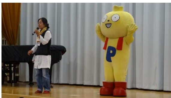
人気のゆるキャラ登場