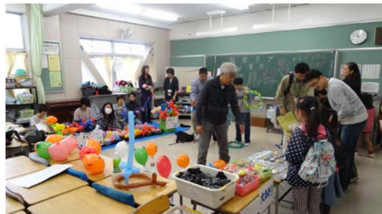
『まとあて』や『わなげ』などを通して、子どもたちとPTA・地域さらに学童クラブのみなさんたちが、一同に子どもたちを楽しませていました。