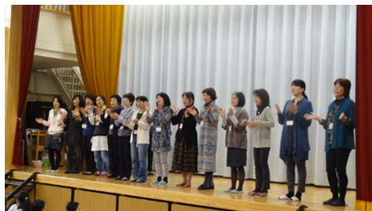
PTAコーラスの『切手のないおくりもの』