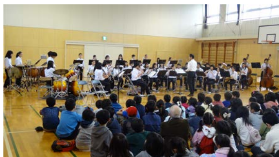
篠原中学校吹奏楽部の演奏