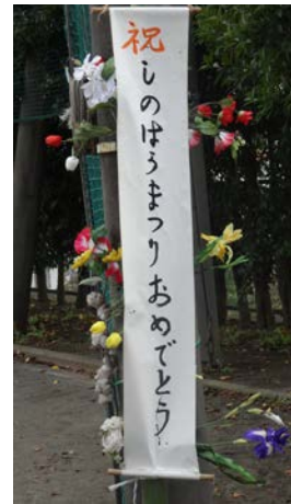
地域の方々を招いて、オープニングセレモニー『しのはら祭り』が開催された。