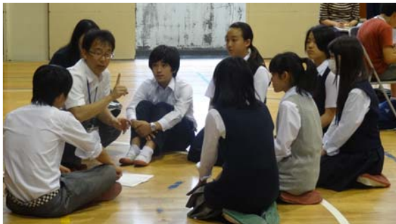
話し合い・進め方を中学生に説明