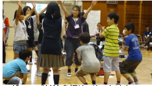
グループ対抗身振りでじゃんけん