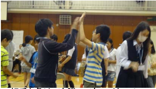
相手と負けても勝ってもハイタッチ