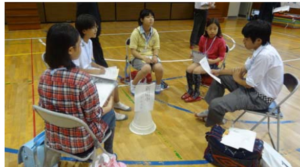
打ち合わせた進め方で司会をする中学生