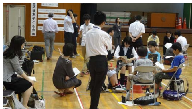
参観する先生方も真剣に話し合いの様子に聞き入っていました

第二回目は方面別で7月17日(水)に横浜ラポールで、第三回目は全市で8月22日(木)横浜シンポジアで開催される。