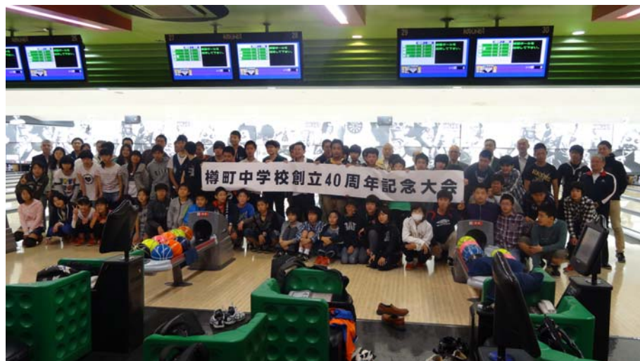
参加者全員で記念写真