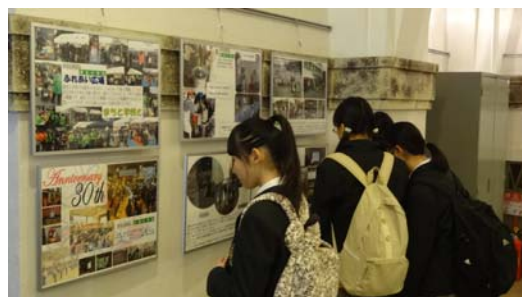
中学生が小学校の様子を参観