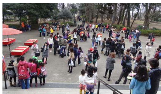
記念館前に集まれた方々