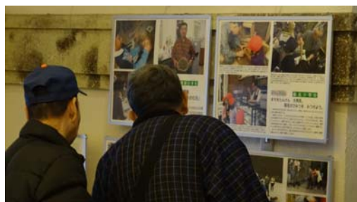
母校の現在の様子を読まれる来館者