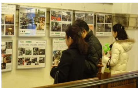
パネル展掲示を読まれメモをとる来館者