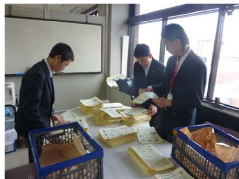
折り込み作業を手伝う