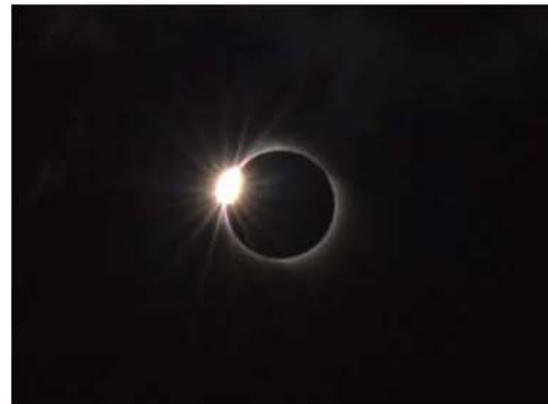
▲2008年8月1日・皆既日食・中国撮影