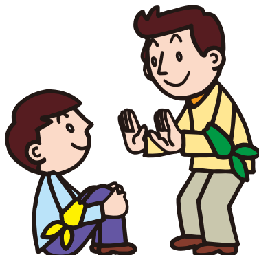
ま 待つ Wait