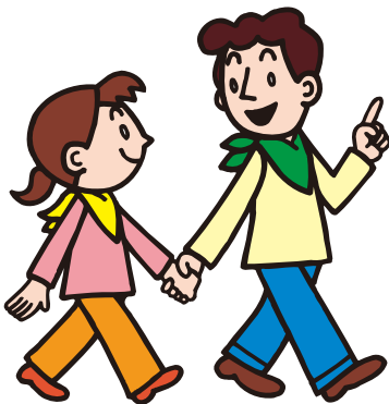
い どう 移動する Move