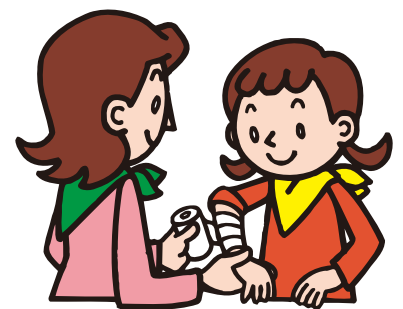
て あ 手当て Care

きいろ 黄色 のバンダナは「支援してほしい」 ・ みどりいろ 緑色 のバンダナは「支援できる」というサインです。