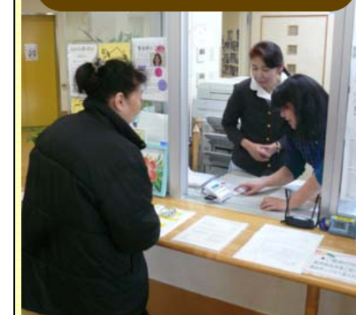
ポイント付与の様子①