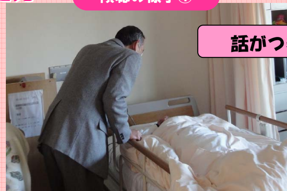
話がつきませんね♪