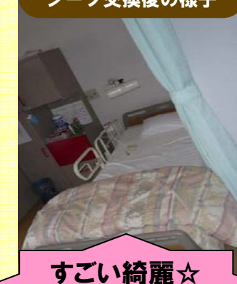
すごい綺麗☆ さすがです♪