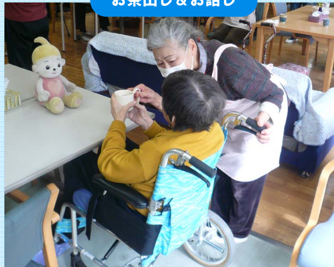
お茶出し & お話し