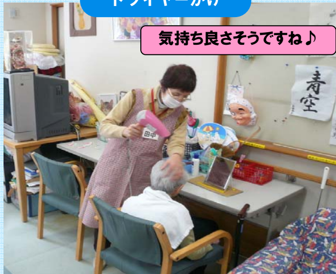
気持ち良さそうですね♪