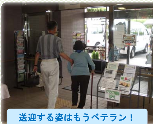
送迎する姿はもうベテラン！