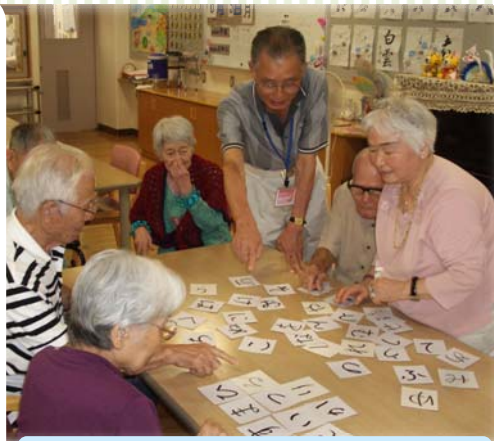
『夏を連想するもの』を考えます