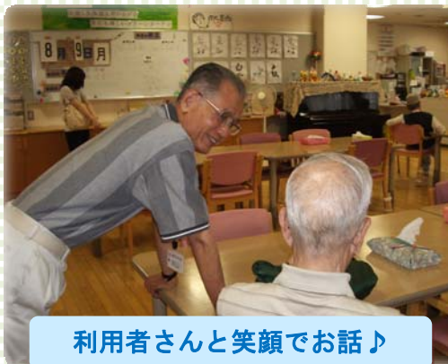
利用者さんと笑顔でお話♪