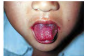
写真1. 典型的な莓舌