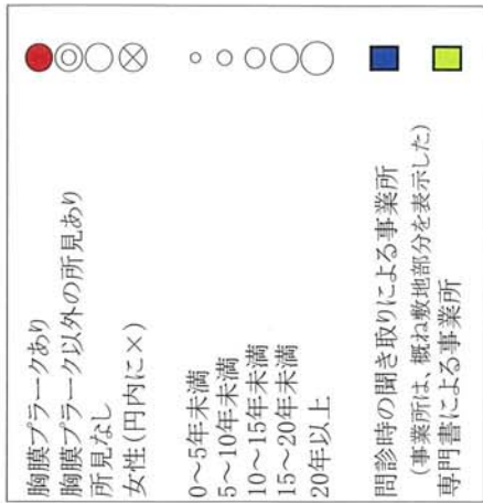
G図：平成元年以前に横浜市鶴見区に居住していた者で、 ばく露歴分類が「オ その他」の者に関するプロット図

平成元年以前に横浜市鶴見区に居住していた者で、 ばく露歴分類が「オ その他」の者に関する プロット数との関係