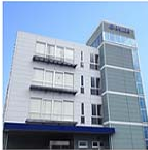
設計・試作・解析センター