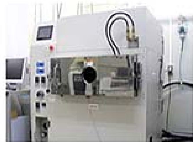
蟻酸リフロー装置