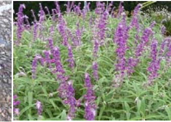
サルビア・レウカンサ