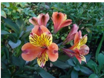
アルストロメリア