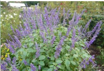
ラベンダーセージ