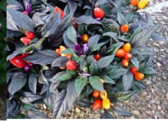
観賞用トウガラシ