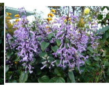
プレクトランサス