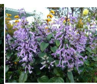
プレクトランサス