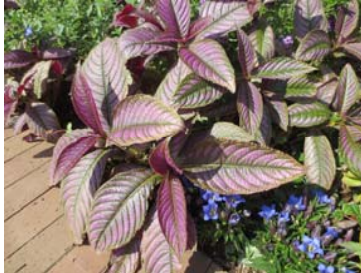
ストロビランサス