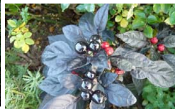
トウガラシ 'ブラックパール'