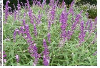
サルビア・レウカンサ