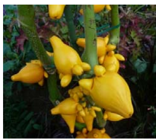
フォックスフェイス