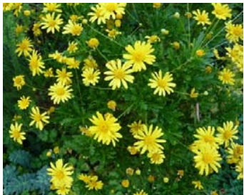
マーガレットコスモス