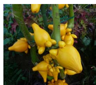
フォックスフェイス