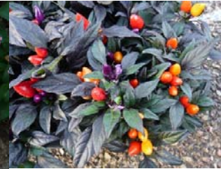
観賞用トウガラシ