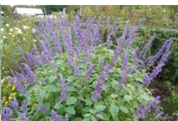
ラベンダーセージ