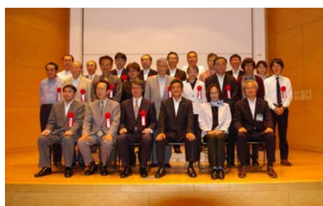
第21回横浜環境活動賞表彰式