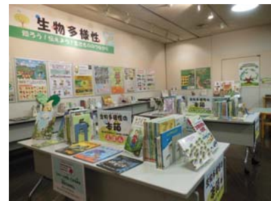
図書館と連携した普及啓発（生きもののつながりキャンペーン）