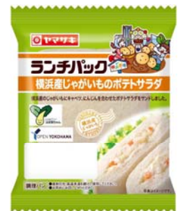
市内産農産物を利用した商品