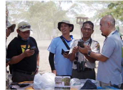
インドネシアにおける繁殖等の技術支援