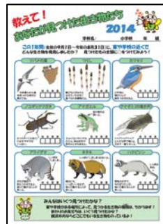
こども「いきいき」生き物調査 2014 調査票