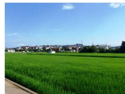
保全された水田（青葉区）