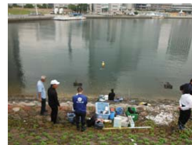
自動車道護岸沿いでのアマモ植え付け