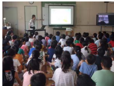
環境教育出前講座