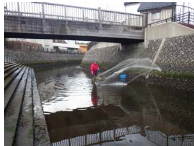
魚類調査の様子(金沢区 宮川)