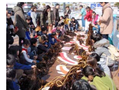
わかめ収穫イベント