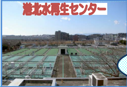
港北水再生センター