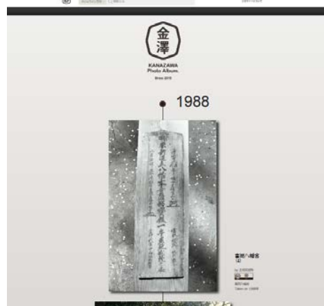
タイムライン表示：撮影された年の古い順に表示