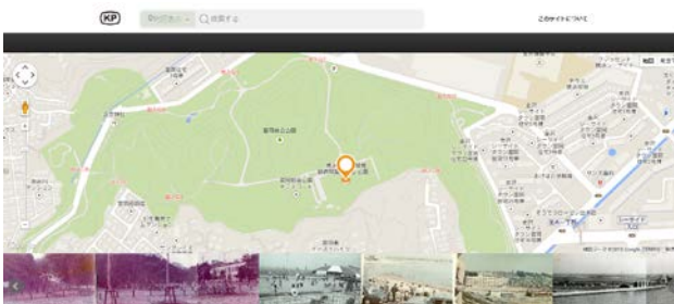
マップ表示：緯度経度情報を持つ画像を地図上に表示