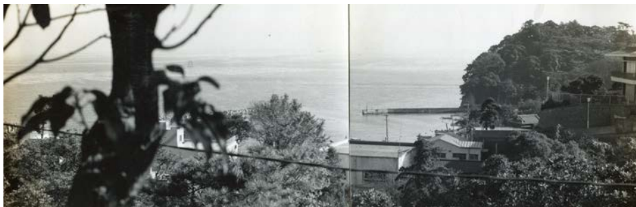
【埋め立て前の富岡八幡宮周辺】