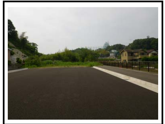
着手前（宝来橋付近より撮影）