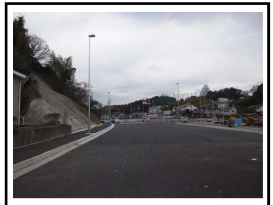
完成後（宝来橋付近より撮影）