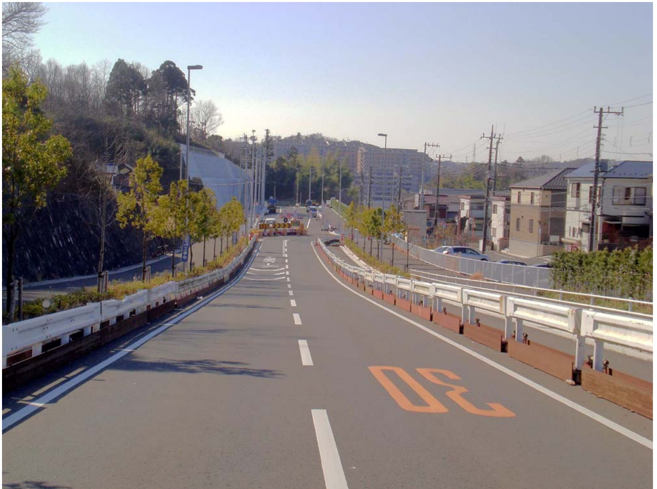
(完成状況 平成21年2月)