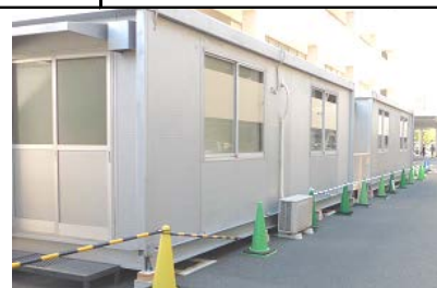
仮設の帰国者・接触者外来(プレハブ)