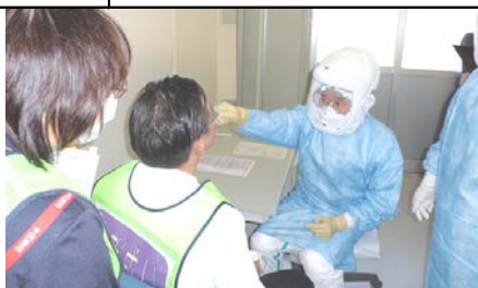
(参考) 過去に行った訓練の様子